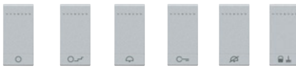
NT4915AN NT4915BN NT4915DN NT4915FN NT4915DD NT4915MR