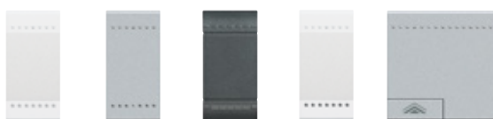
N4915N NT4915N L4915N N4915LN NT4915M2ADN